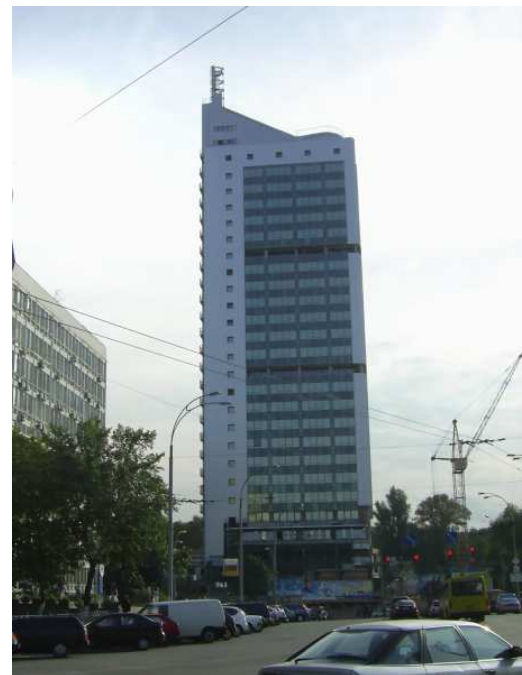
Рисунок 1. Общий вид здания по ул. Соломенской 2а с дымовыми трубами на отм. 120,5 м

Был возведен каркас здания с навесными керамзитобетонными панелями, после чего строительство было прекращено и здание «законсервировано». В 2004 году начата масштабная реконструкция здания, в ходе которой проектной организацией было Принято решение о размещении на отметке + 5,90 м, в надстройке стилобатной части здания, автономной газовой котельной мощностью 3,4 мВт. Проектной организацией при выборе места размещения котельной и оборудования учитывались следующие факторы: загрузка тепловых сетей в районе строительства, эксплуатационные расходы на отопление, горячее водоснабжение и климатизацию помещений здания, статические нагрузки на каркас и фундаменты, противопожарные и санитарные нормы. Объёмно-планировочные и конструктивные решения котельной приняты согласно требований «Рекомендаций по проектированию крышных, встроенных и пристроенных котельных установок...» ( Разъяснения к СНиП II-35-76).